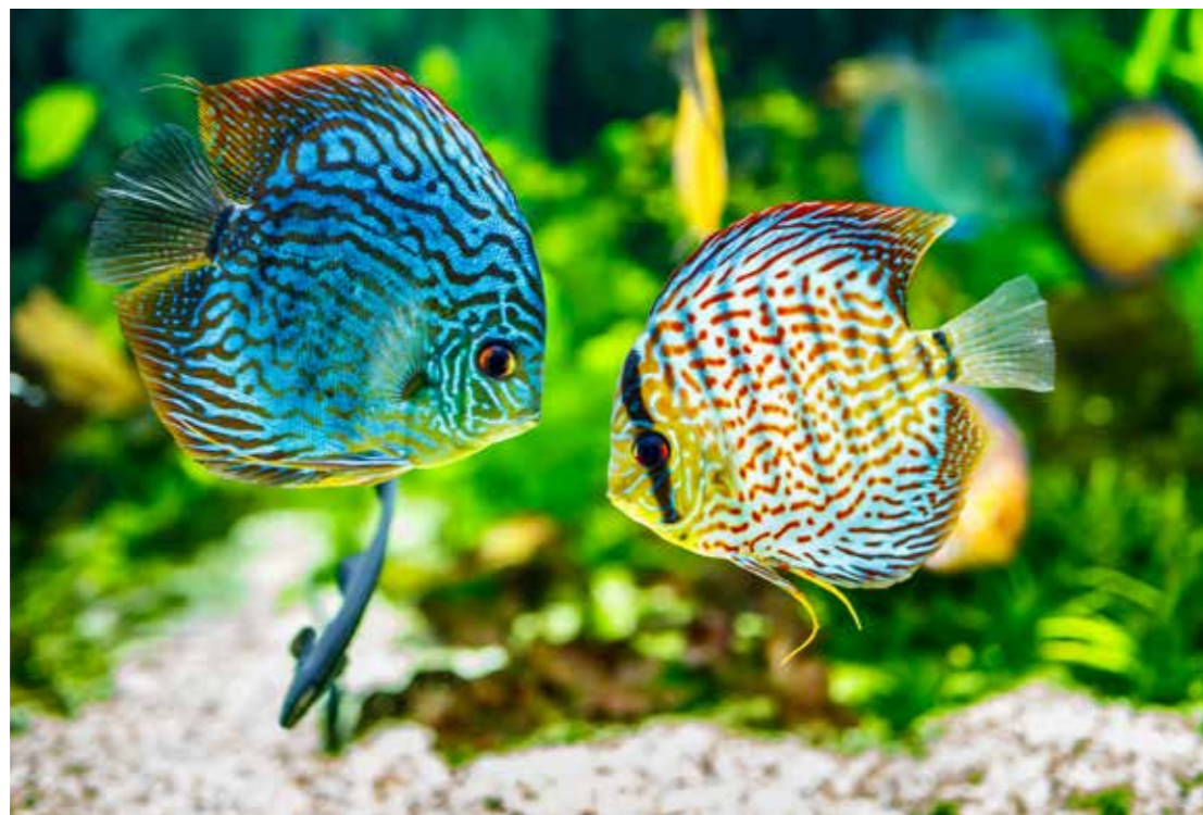
Einige Fischarten, wie der Echte Diskus, setzen ein grosses Fachwissen in Bezug auf eine artgerechte Haltung voraus. Sie gehören daher nur in erfahrene Hände.

Will man Aquarienfische halten, ist man dafür verantwortlich, dass es ihnen gut geht. Dies ist auch im Tierschutzgesetz so verankert. Deshalb muss man sich wie bei allen Heimtierhaltungen vor der Anschaffung der Tiere gründlich über die Bedürfnisse der Fische informieren. Das ist keine leichte Aufgabe, denn die vielen im Handel angebotenen Arten haben oftmals sehr unterschiedliche Ansprüche an ihre Umwelt. Will man den Fischen gerecht werden, muss man also wissen, welches das Ursprungsgebiet der Fische ist, wo sie sich gerne aufhalten, welche Nahrung sie wie aufnehmen und wie sich ihr Tagesrhythmus gestaltet, denn es gibt tag- und nachtaktive Arten. Das hat alles Einfluss darauf, welche Arten man miteinander vergesellschaften kann. Allgemein wird empfohlen, ein Biotop-Aquarium