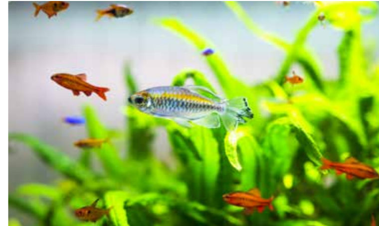
Bei Vergesellschaftungen müssen die Bedürfnisse der einzelnen Arten unbedingt zueinander passen.

Bei der Einrichtung des Aquariums muss man sich ebenfalls an den Eigenheiten der jeweiligen Arten, die man halten will, orientieren. Versteckte, Rückzugsbereiche oder Höhlen